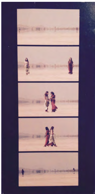
Bill Viola - The Encounter -

Elle ajoute : "Pour moi l'infini c'est la forme la plus contemporaine possible ; six milliard d'hommes." 17