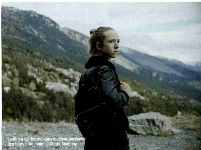
Le film a été tourné dans le décor particulier des tours d'Aminona, à Crans-Montana.